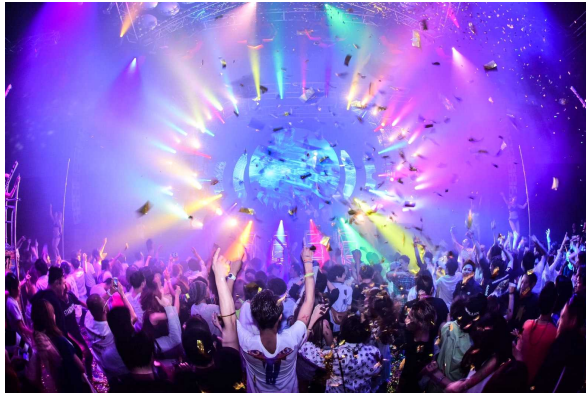
FULL MOON RAVE

2017年6月9日(金)の満月の夜に FULLMOON RAVE 2017 として新木場「ageha」で開催し、3000人以上動員した話題沸騰のイベント。