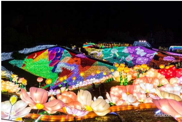
グランイルミ 2nd シーズン