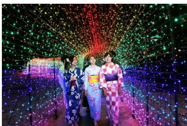
浴衣とイルミは相性抜群！フォトジェニックな写真が撮れます