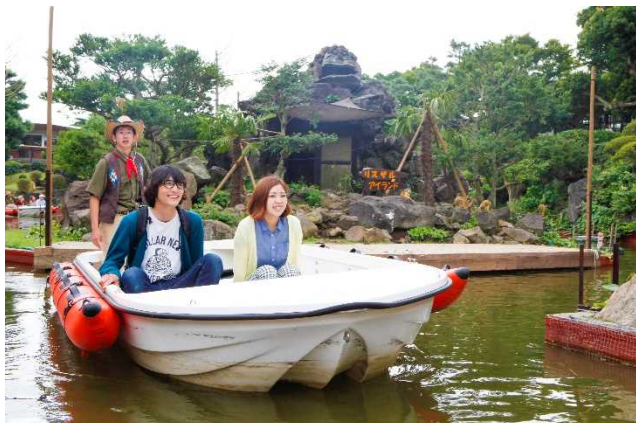
「アニマルボートツアーズ」