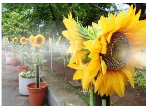
「ひまわりミスト」イメージ