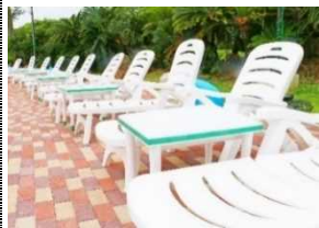
トロピカルエリア