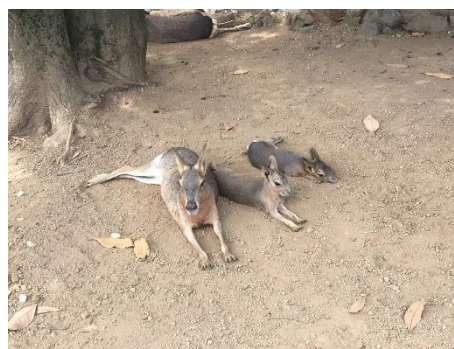
「太陽の広場」マーラの赤ちゃん