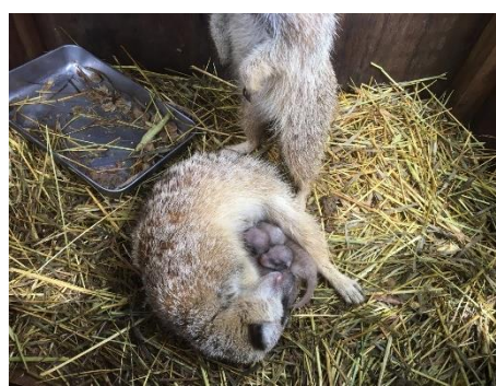
「噴火湖」沿岸展示場 ミーアキャットの赤ちゃん

伊豆シャボテン動物公園では、2018年6月から7月にかけて、リスザル、クジャク、マーラ、ミーアキャットの赤ちゃんが誕生しました。リスザルの赤ちゃんは4頭が誕生し、現在は赤ちゃんを含め合計23頭(内赤ちゃん1頭が島に生息)が元気に過ごしており、さらに1頭が妊娠中です。1日4回開催している「リスザルくんごはんタイム」にて間近でご覧いただけます。クジャクのヒナは7羽(4羽連れ、2羽連れ、1羽連れ)が生まれ、マーラの赤ちゃんは7頭誕生しております。