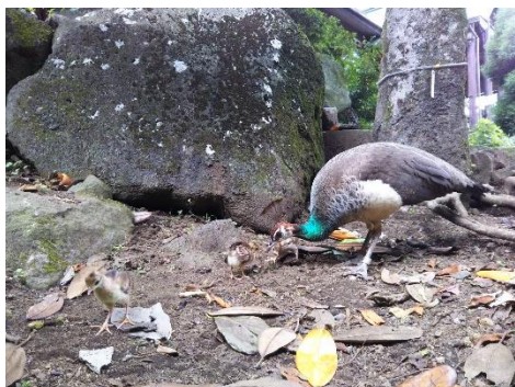
クジャクの赤ちゃん