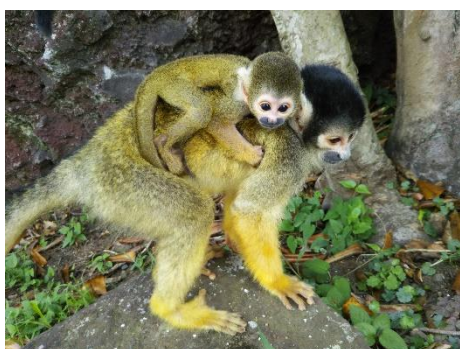
「リスザルの森」リスザルの赤ちゃん