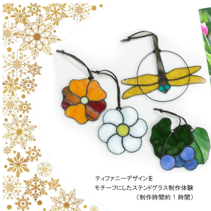
ティファニーデザインを モチーフにしたステンドグラス制作体験 (制作時間約1時間)