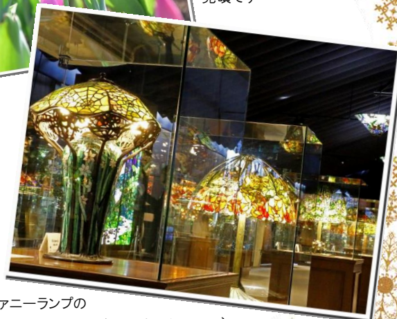
ティファニーランプの スペシャルガイドツアー(所要時間約30分)

ニューヨークランプミュージアム&フラワーガーデンでは、2018年12月22日(土)~24日(月)の3日間、当園では初となる制作体験イベントを開催いたします。