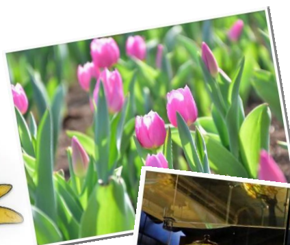
フラワーガーデンは アイスチューリップが 見頃です