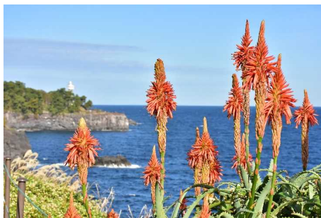
海の青と門脇灯台、アロエの赤い花が織りなす絶景