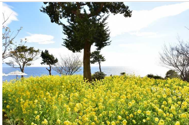
つなきり岬の菜の花