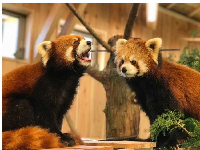
「ヨモギ」(左)と「コナツ」(右)の様子 ※写真は 3/8(金)撮影

伊豆シャボテン動物公園では開園 60 周年を記念して、2019 年 3 月 16 日(土)に「レッサーパンダ館」をオープンいたします。