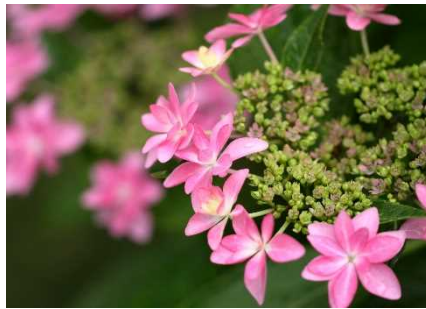
【ダンスパーティー】