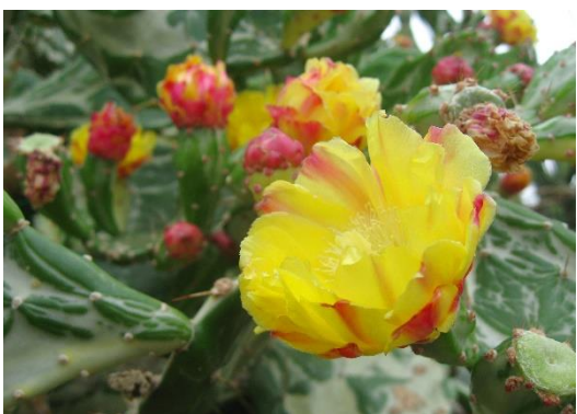
縁起の良い名前のサボテン、第 1 温室「初日の出」