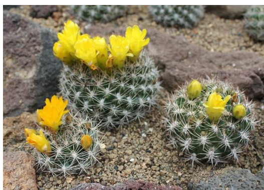
第 1 温室「花笠丸(はながさまる)」