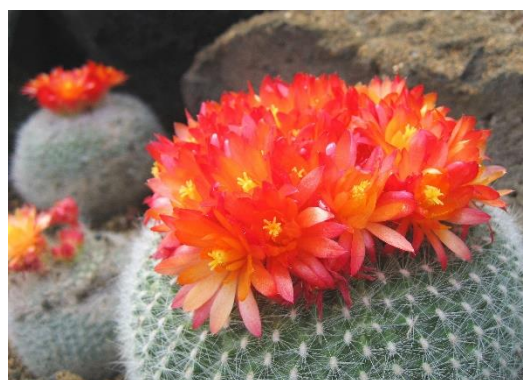
第 1 温室「雪晃(せっこう)」