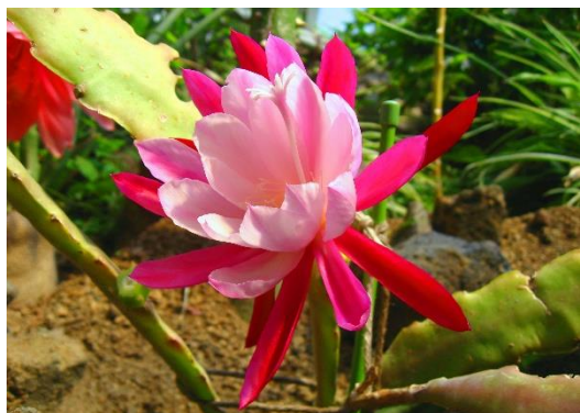
第 3 温室「孔雀(くじゃく)サボテン『ミロ』」