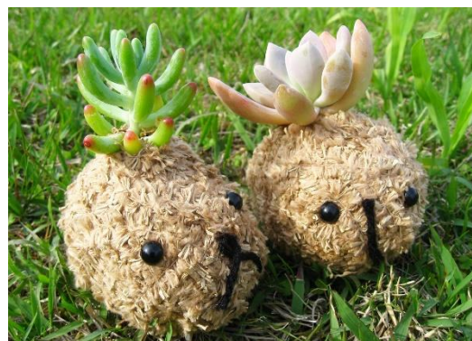
カビバラのこけだま