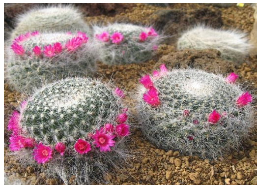
第 5 温室「玉翁(たまおきな)」