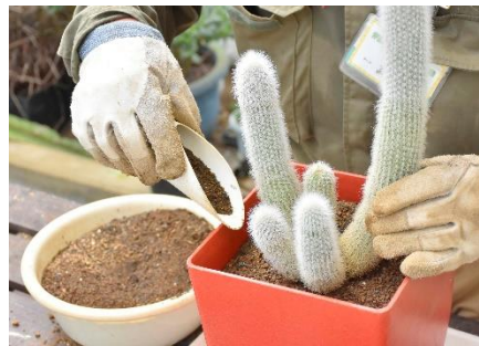
穏やかで真面目な人柄どおり、植物を扱う時も優しく、丁寧。