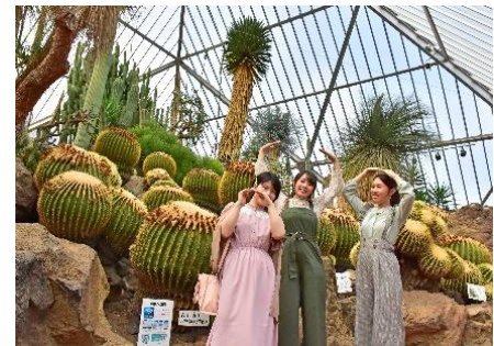
2020年 樹齢約170年の「金鱗」をバックに