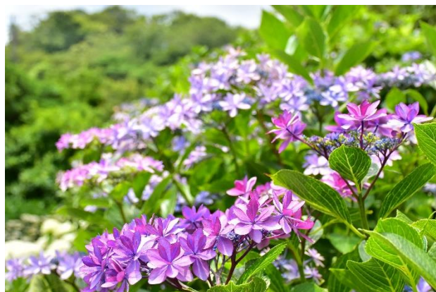
【ダンスパーティー】