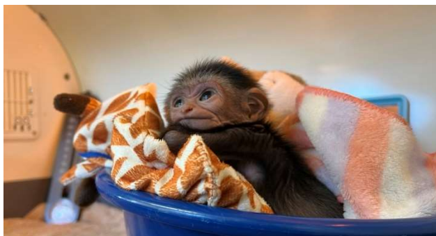
※赤ちゃんは体長 25～30cm、体重 492g(2021.12/21 現在)

【生態】 東南アジアに分布する希少な類人猿で、IUCN のレッドリストにより絶滅危惧種に指定されている。体色には様々なパターンがあるが、いずれも顔のまわりと手足の先が白いのが特徴で名前の由来となっている。四肢が発達しており腕力や握力も強く、樹上では長い腕を使って枝から枝へと敏捷に移動する。家族単位の群れで昼間活動して主に果実や若葉などの植物を、ほかに昆虫や鳥の卵なども食べる。妊娠期間は約7ヶ月。