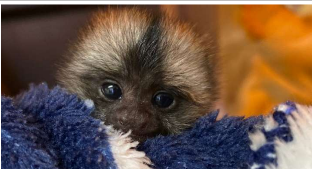
※赤ちゃんは体長 5cm、体重 30g (2021.12/21 現在)