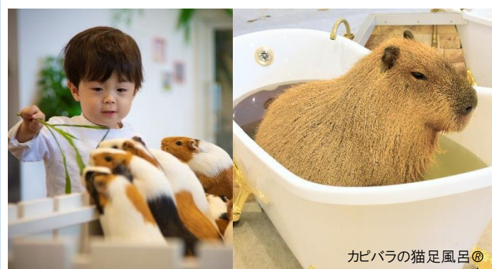
カピバラの猫足風呂®