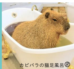
カピバラの猫足風呂®