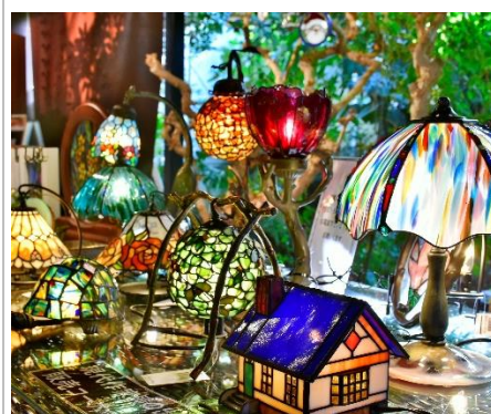
ステンドグラス小作品販売コーナー