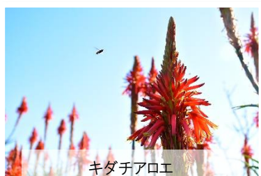
キダチアロエ 12月中旬～2月上旬