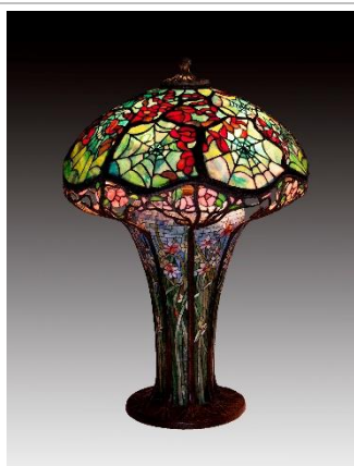
佐々木真弓氏 作「コブウェブ」