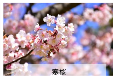
寒桜 1月上旬～2月上旬