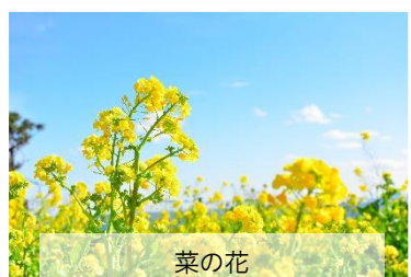
菜の花 12月中旬～1月下旬