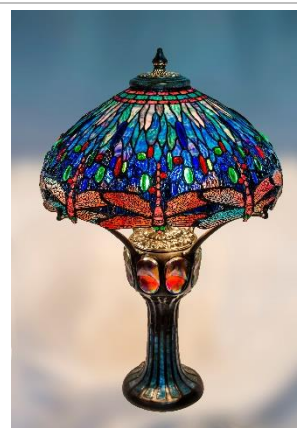
徳重くるみ氏 作「ドラゴンフライ」