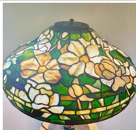
大村房子氏 作「ピオニー」