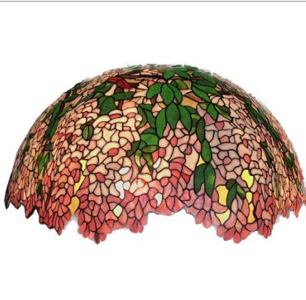
かわもと工房 作「ラバーナム」