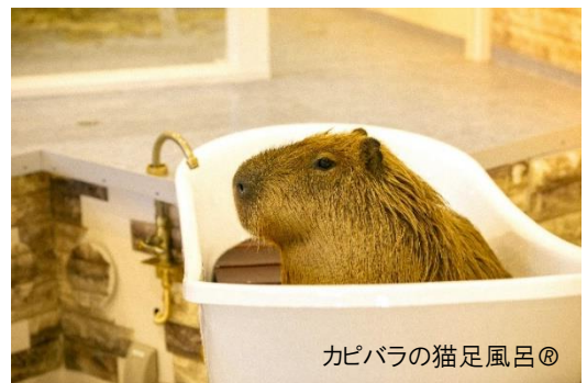
カピバラの猫足風呂®