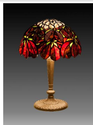
佐々木真弓氏 作「チェストナット」