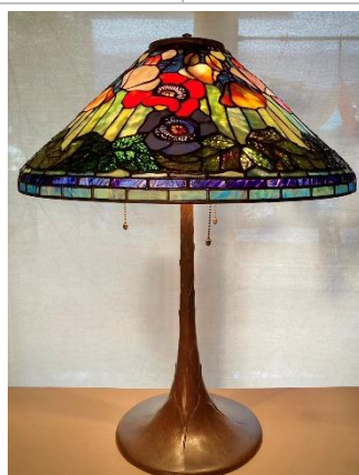
緒方修一氏 作「ポピー」