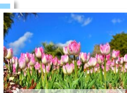
アイスチューリップ 12月下旬～1月中旬