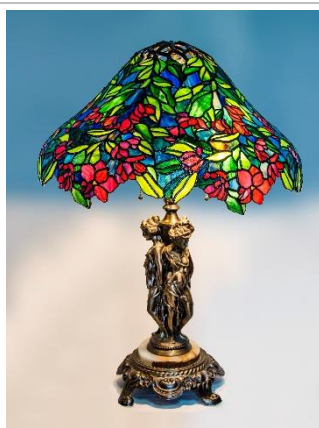
徳重くるみ氏 作「アザレア」