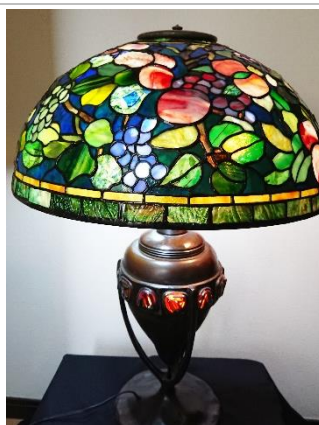
大村房子氏 作「フルーツ」