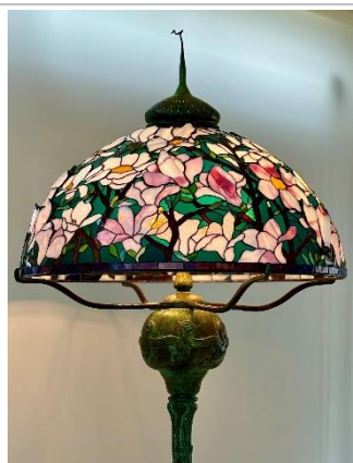
かわもと工房 作「マグノリア」