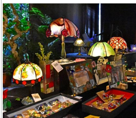
ステンドグラス小作品販売コーナー