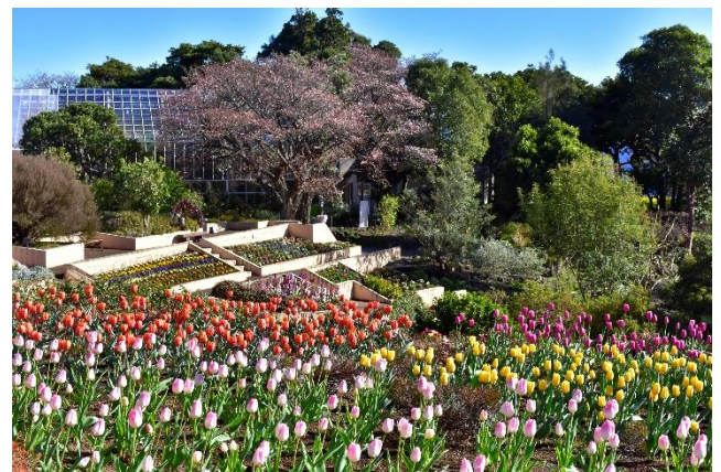
カラフルなアイスチューリップの先には見頃を迎えた寒桜の大きな木が