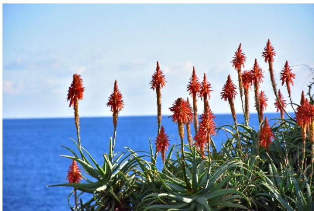
赤いとんがり帽子のようなキダチアロエも園内各所で見頃に