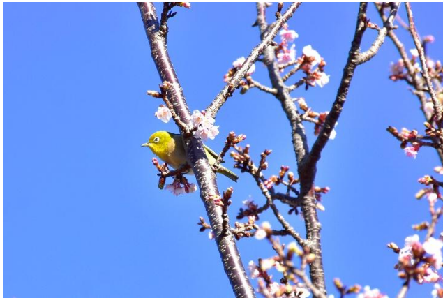
メジロたちが飛来して、桜とともに一足早い春を告げてくれる