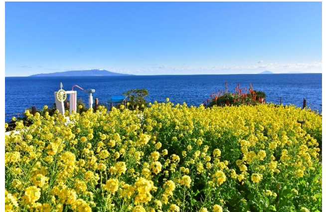
伊豆大島を望む岬の花畑では、菜の花と海とのコントラストが美しい